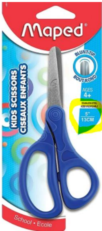
Photo à titre indicatif uniquement, c'est une suggestion de l'ergothérapeute